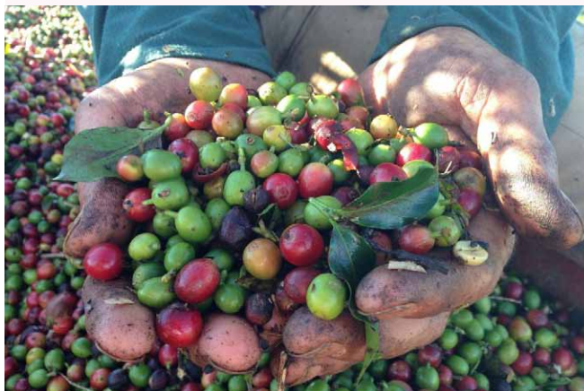
Fókuszban a kávé